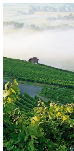
Blick über die Reben im aargauischen Islisberg.

KC-Institut, Sonnenhof 1, Bülach. Telefon 043 928 25 41, www.kc-institut.ch.